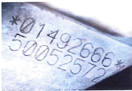
N° DO MOTOR