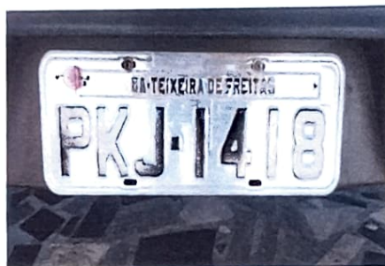
LACRE /QR CODE