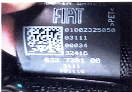
CINTO DE SEGURANÇA