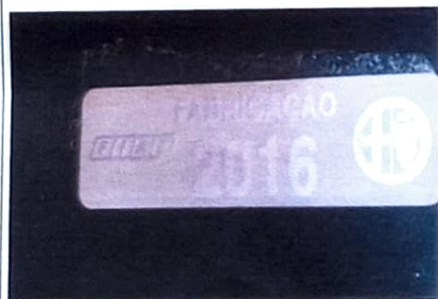
ETA DO BATENTE DA PORTA