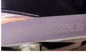
C & M VISTORIAS LTDA - ME DATA: 17/05/2024 HORA: 16:50:13