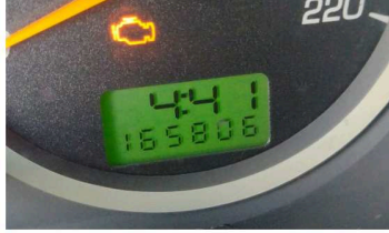
C & M VISTORIAS LTDA - ME DATA: 17/05/2024 HORA: 16:42:54