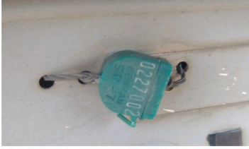
C & M VISTORIAS LTDA - ME DATA: 17/05/2024 HORA: 16:44:59