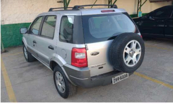
C & M VISTORIAS LTDA - ME DATA: 17/05/2024 HORA: 16:43:38