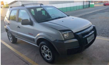
C & M VISTORIAS LTDA - ME DATA: 17/05/2024 HORA: 16:44:34