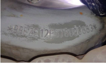
C & M VISTORIAS LTDA - ME DATA: 17/05/2024 HORA: 16:45:55