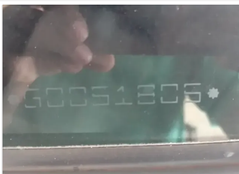
GRAVAÇÃO DOS VIDROS