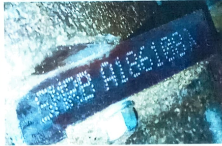
N° DO MOTOR