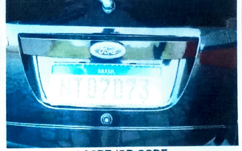
LACRE /QR CODE