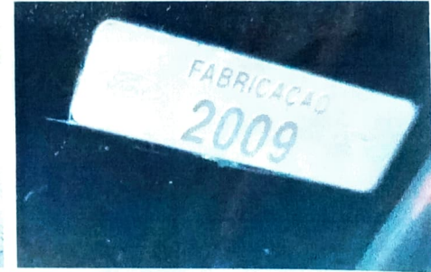
ETA DO COMP. DO MOTOR