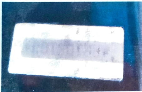
ETA DO BATENTE DA PORTA