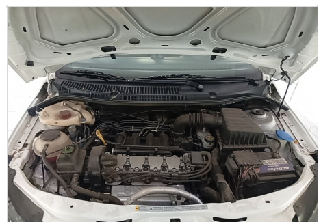
COMPARTIMENTO DO MOTOR