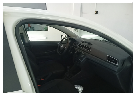
LAT DIREITA (BOR. ABAIXADA)