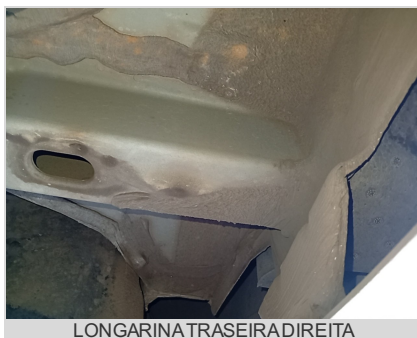
LONGARINA TRASEIRA DIREITA