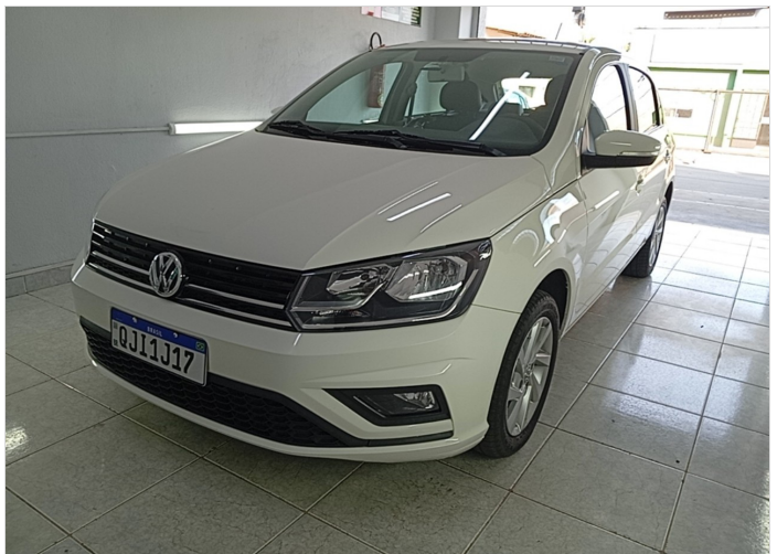
DIANTEIRAC/ LATERAL ESQUERDA