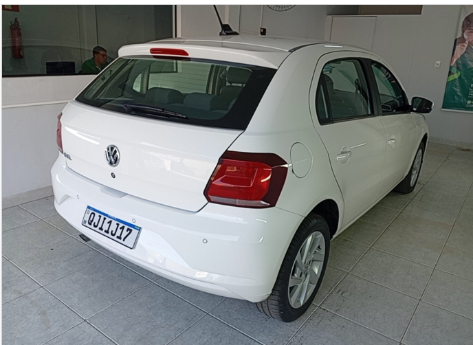
TRASEIRAC/ LATERAL DIREITA