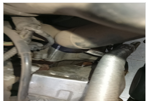
CAIXA DE CÂMBIO