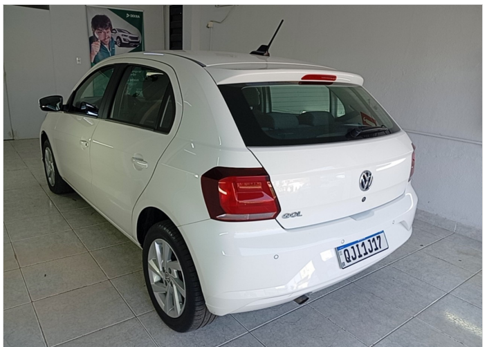
TRASEIRAC/ LATERAL ESQUERDA