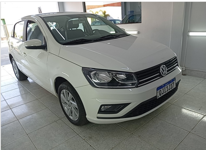
DIANTEIRAC/ LATERAL DIREITA