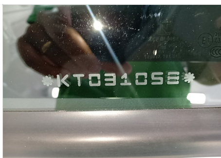
GRAVAÇÃO DOS VIDROS