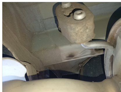
LONGARINA TRASEIRA ESQUERDA