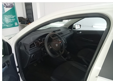
LAT ESQUERDA (BOR. ABAIXADA)