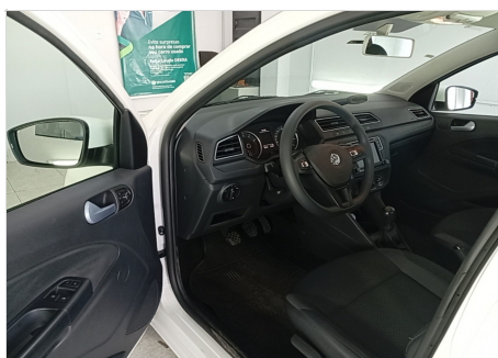
PAINEL DE INSTRUMENTO