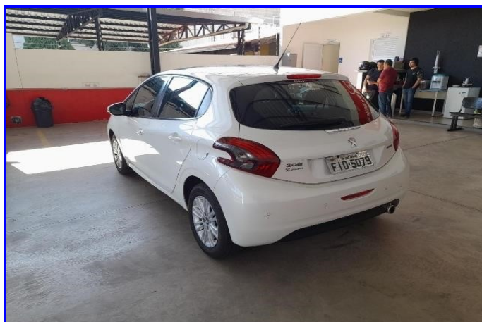
TRASEIRA ESQUERDA 90°