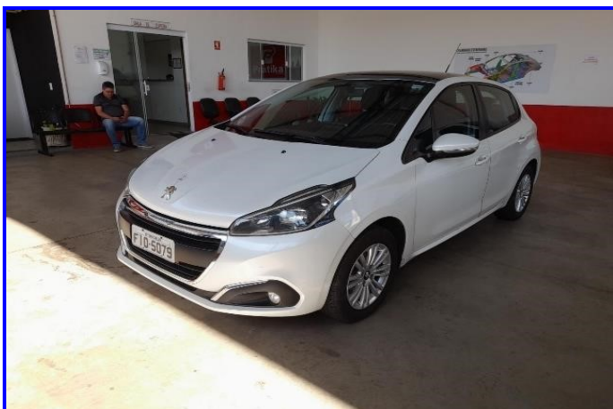
DIANTEIRA ESQUERDA 90°