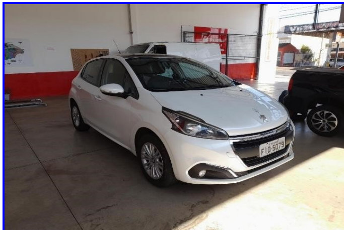
DIANTEIRA DIREITA 90°