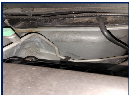
Torre amort diant/direita