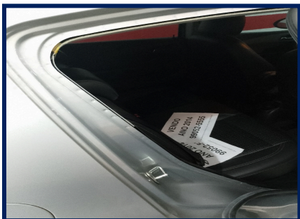
Trilho Coluna Tras. Dir