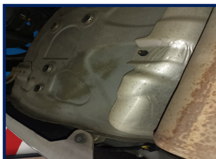
Junção Assoalho/Painel Tras