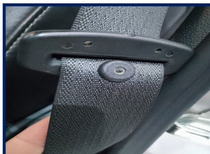
Data Cinto Segurança