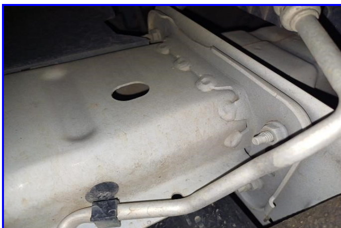
LONGARINA DIANTEIRA DIREITA