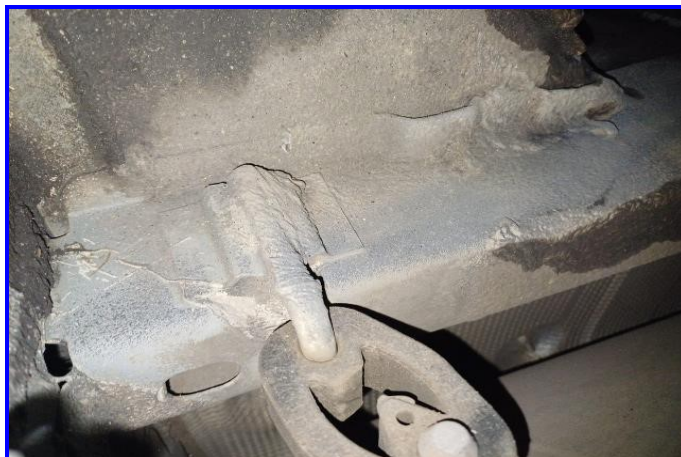
LONGARINA TRASEIRA DIREITA