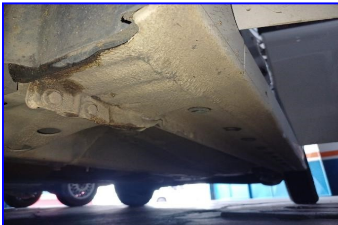
CAIXA DE AR LADO ESQUERDO