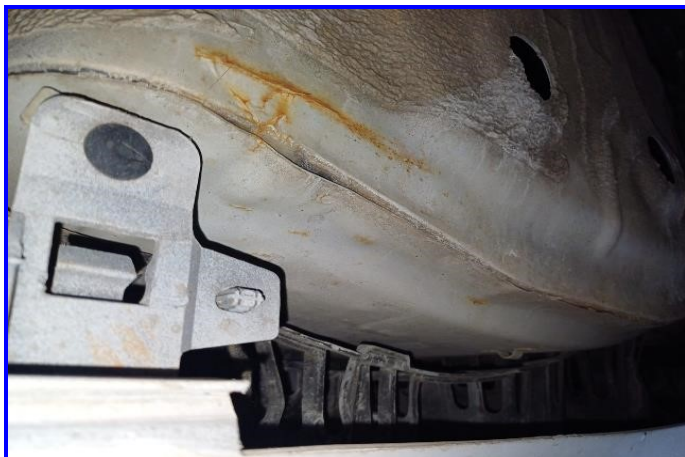
PAINEL TRASEIRO EXTERNO