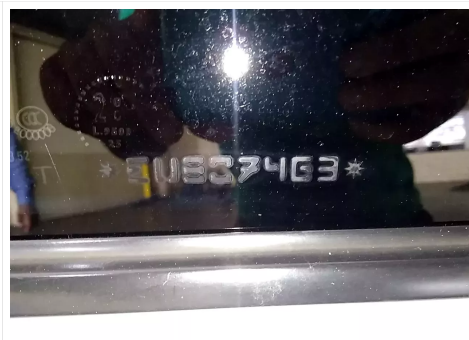
GRAVAÇÃO DOS VIDROS