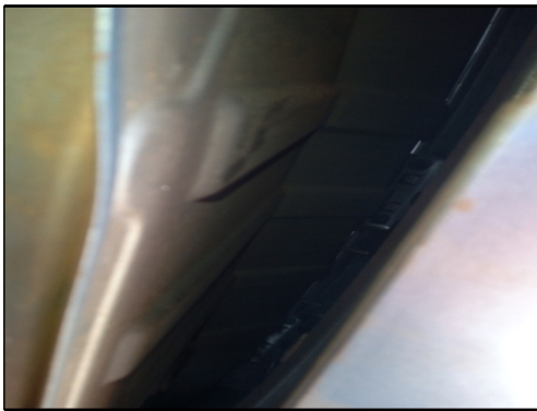
CAIXA DE AR ESQ.