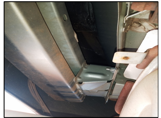
CAIXA DE AR DIR.