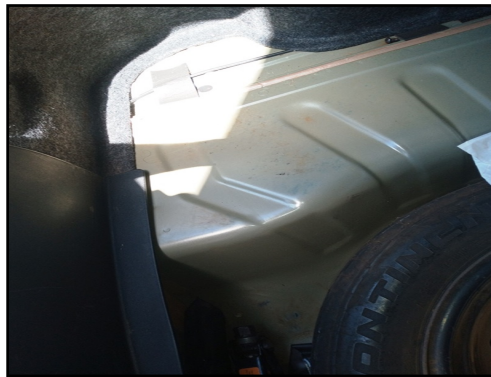
ASSOALHO INT. PORTA MALAS