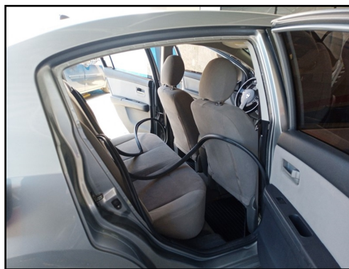
TRILHO COLUNA TRAS. DIR