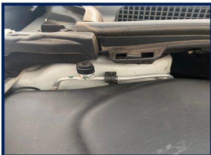
Torre amort diant/direita