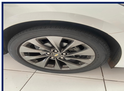
Pneus/Rodas Diant. Esq.