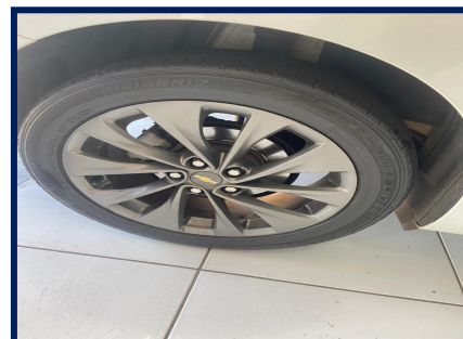
Pneus/Rodas Traseiro Esq.