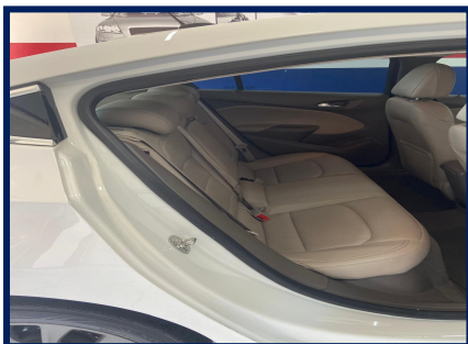
Trilho Coluna Tras. Dir