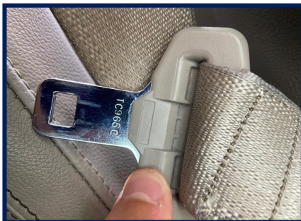
Data Cinto Segurança