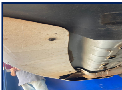
Junção Assoalho/Painel Tras