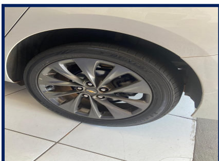
Pneus/Rodas Traseiro Dir.