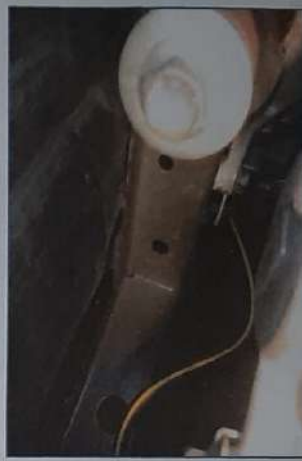
LONGARINA DIANT DIR