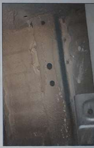
LONGARINA TRAS DIR