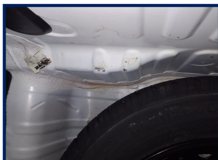
Junção Assoalho/Painel Tras