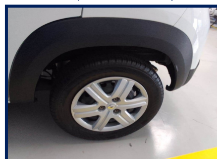
Pneus/Rodas Traseiro Esq.