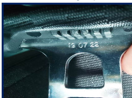
Data Cinto Segurança