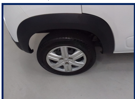
Pneus/Rodas Traseiro Dir.