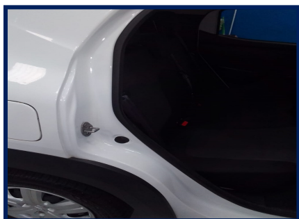
Trilho Coluna Tras. Dir