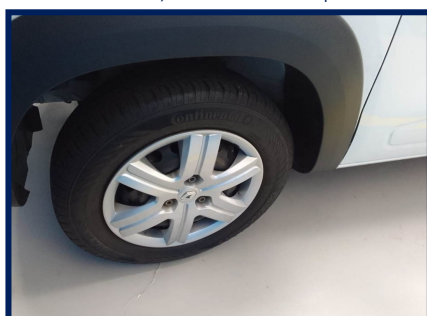
Pneus/Rodas Diant. Esq.