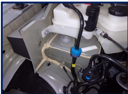
Torre amort diant/direita