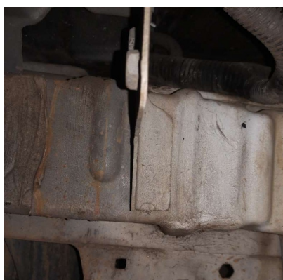
Longarina dianteira esquerda