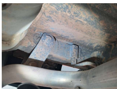
Longarina traseira esquerda