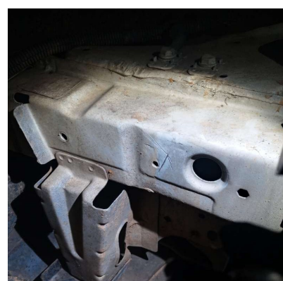
Longarina dianteira direita