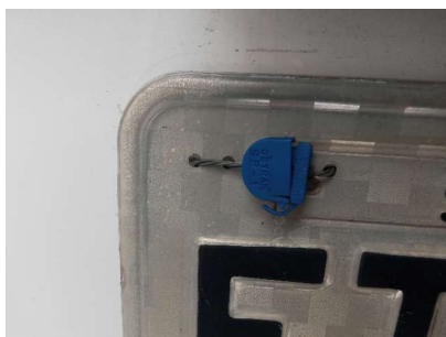
Lacre da Placa/QRCode