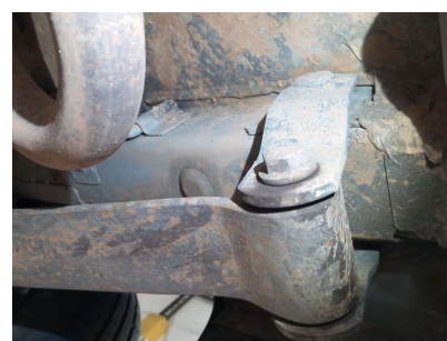
Longarina traseira direita