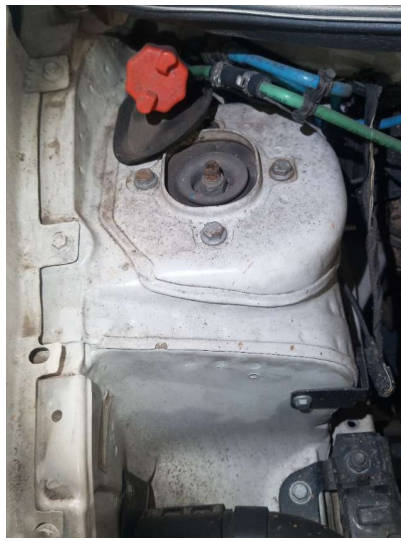
Torre dianteira direita