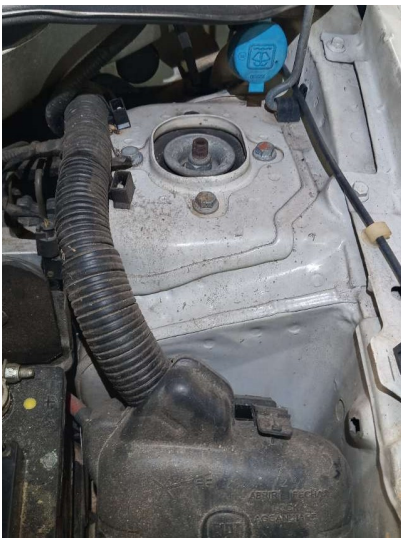
Torre dianteira esquerda