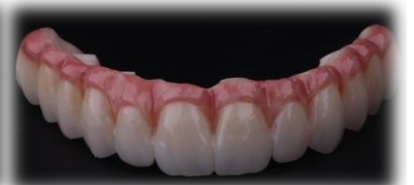
PROTOCOLOS EM ZIRCÔNIA