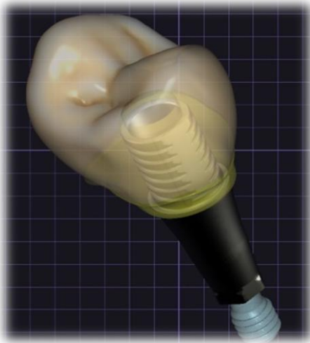
PRÓTESES FIXAS SOBRE IMPLANTE