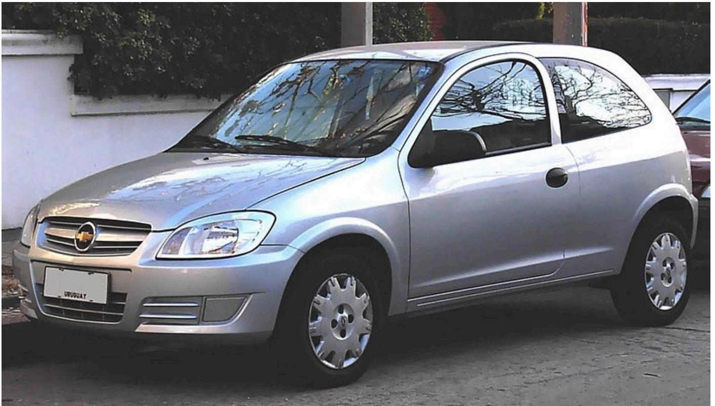
Chevrolet Celta (2001 – 2015) – Avaliação, review e opinião