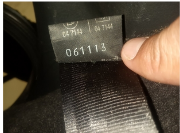
Etiqueta do Cinto de Segurança DATA DE CINTO 06/11/13