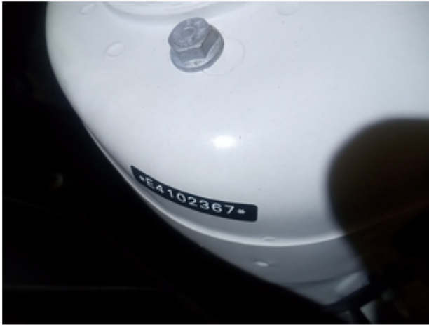
Etiqueta do Motor