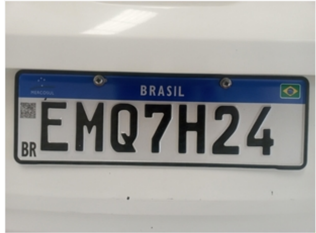
Lacre da Placa QR CODE