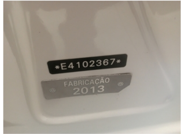
Etiqueta do Batente da Porta