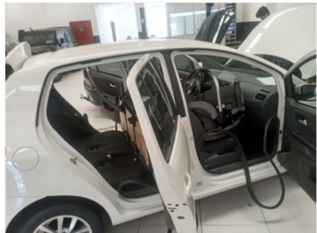
Lateral direita SEM REPAROS/AVARIAS