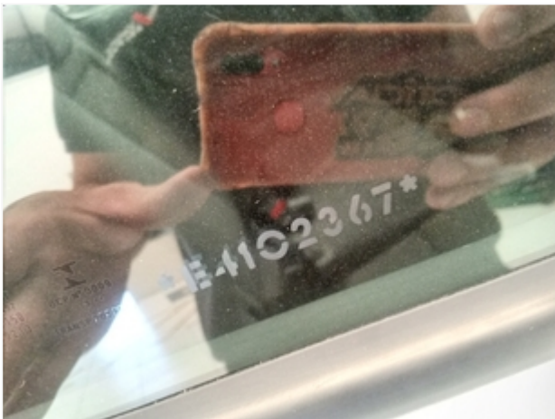
Vidro da porta traseira direita