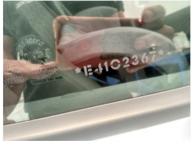
Vidro da porta dianteira direita