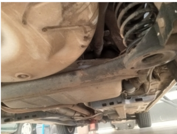
Assoalho SEM REPAROS/AVARIAS