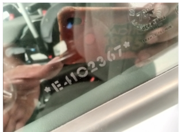
Vidro da porta dianteira esquerda