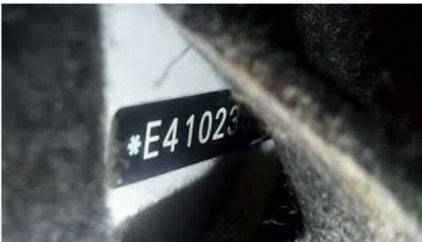
Etiqueta do assoalho(facultativo para veículos acima de 1999)