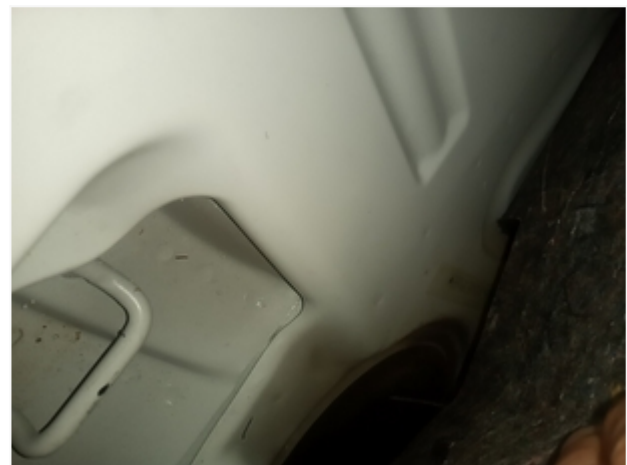
Foto Extra 12 SEM REPAROS/AVARIAS REGIÃO DO CHASSI