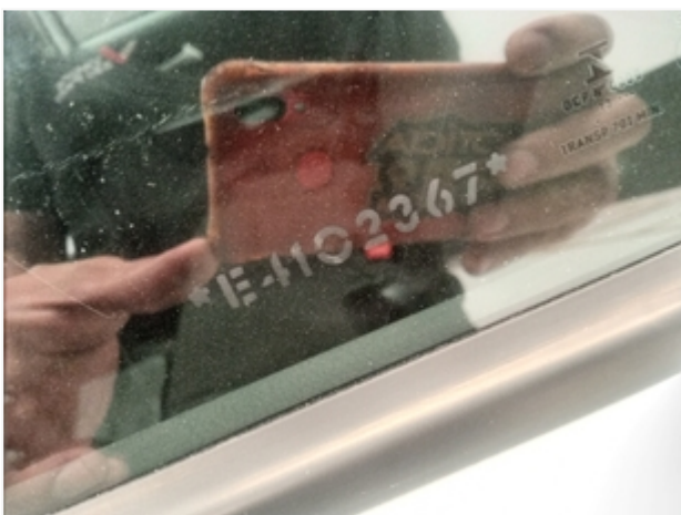
Vidro da porta traseira esquerda