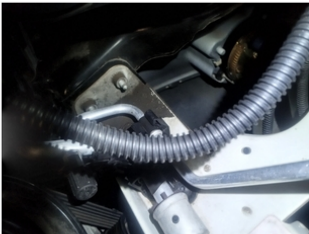
Longarina Dianteira Direita SEM REPAROS/AVARIAS