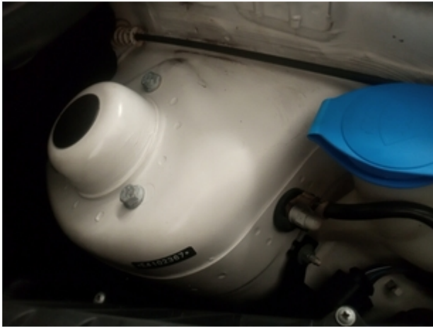
Torre Esquerda SEM REPAROS/AVARIAS