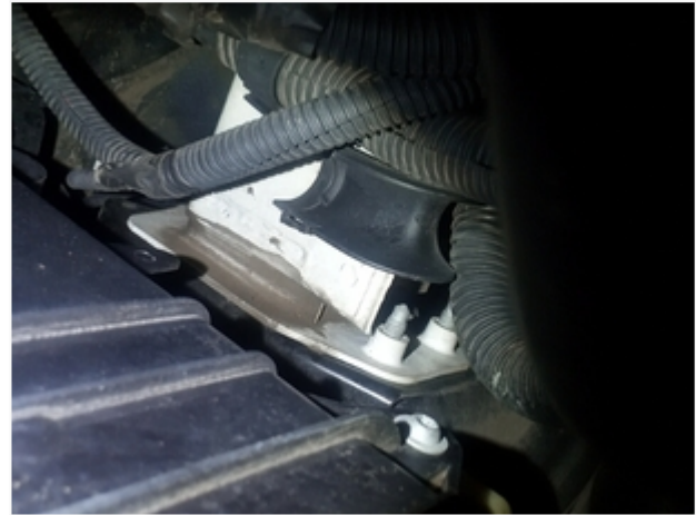
Longarina Dianteira Esquerda SEM REPAROS/AVARIAS