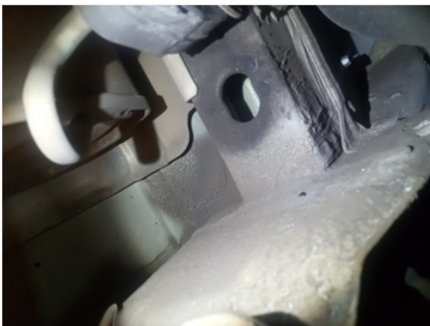
Longarina Traseira Esquerda SEM REPAROS/AVARIAS