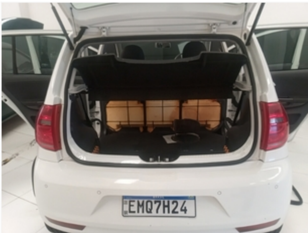
Porta Malas SEM REPAROS/AVARIAS