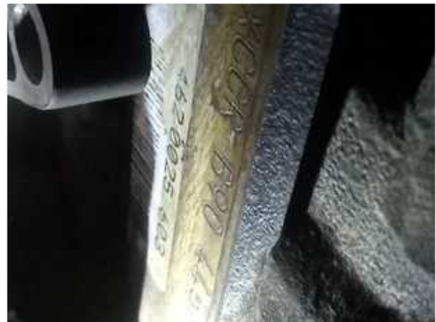
Número do Motor CCRB90445