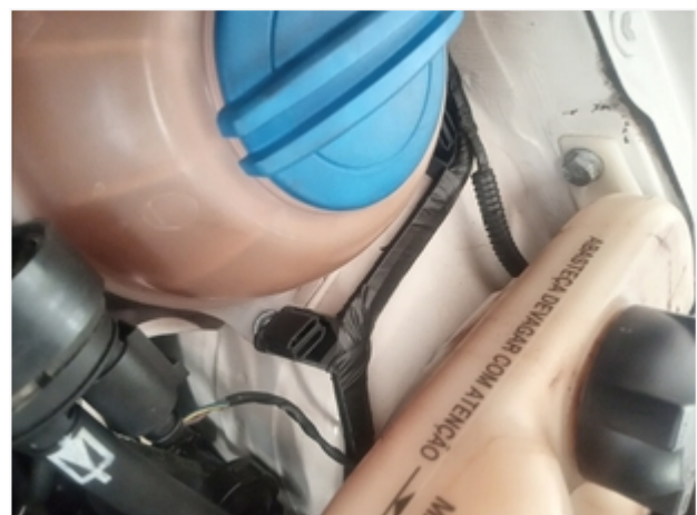
Torre Direita SEM REPAROS/AVARIAS