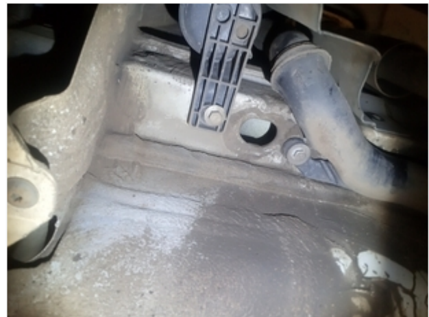
Longarina Traseira Direita SEM REPAROS/AVARIAS