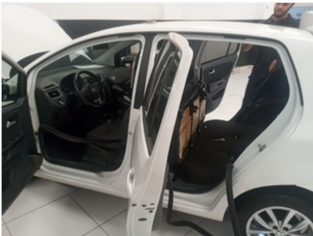
Lateral esquerda SEM REPAROS/AVARIAS