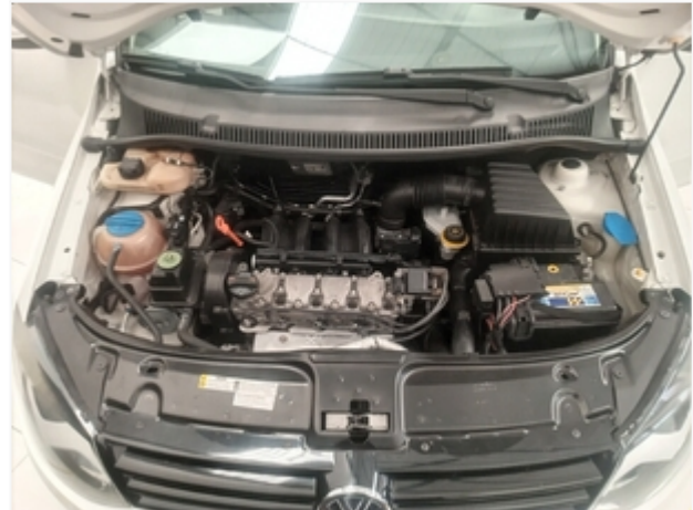
Compartmento do motor SEM REPAROS/AVARIAS