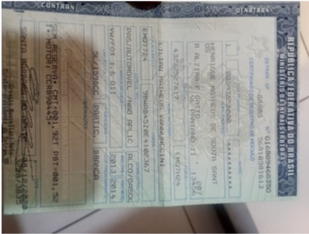
Documento do Veículo